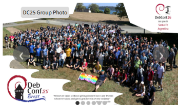
DC25 Group Photo